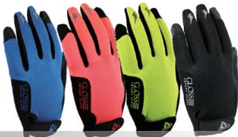
715 Short Gloss PU

手首ショートタイプで 腕時計をしてもあたらぬ。 存在感のあるグロス(艶) 甲メリ使用。