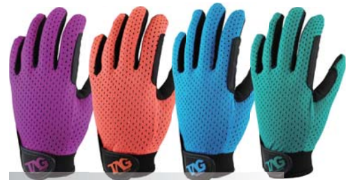
198 Stretch Soft

手首ショートタイプで 腕時計をしてもあたらぬ。 存在感のあるグロス(艶) 甲メリ使用。