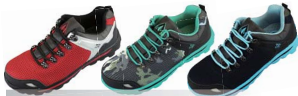
B-27 Bubble Sneaker

エラスチック素材使用で 異物の侵入をカットし、 フィット感も抜群。 インジェクションソールが 悪路でも路面をキャッチ!