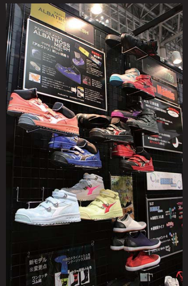
2017年EXPOの弊社ブース写真です