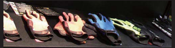
2017年EXPOの弊社ブース写真です